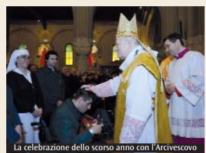
La celebrazione dello scorso anno con l'Arcivescovo