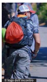
Il logo dell'incontro

Dall'11 al 13 febbraio il polo fieristico di Rho-Pero ospita la Bit (Borsa internazionale del turismo), con alcuni giorni dedicati ai soli operatori e altri aperti anche al pubblico. All'interno di questa kermesse - dalla prima edizione del 1980 - i pellegrinaggi guidati dalla Conferenza episcopale italiana (Cei) e il Pontificio Consiglio per i migranti e gli itineranti hanno trovato una collocazione portando la propria specificità e sensibilità e organizzando una tavola rotonda ormai entrata nella tradizione. L'appunta-