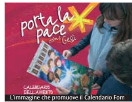
L'immagine che promuove il Calendario Fom

«Porta la pace come Gesù» è la sfida che il nuovo Calendario dell'Avvento ambrosiano, realizzato dalla Fondazione oratori milanesi (Fom), chiederà ai bambini e ai ragazzi nel cammino verso il Natale per vivere ogni giorno piccoli gesti ed esercizi per aprirsi al perdono, alla carità, alla gioia e alla pace. E imparare a fare «come Gesù», portando la pace come frutto di misericordia. Il Calendario dell'Avvento è stato pensato in occasione dell'apertura del Giubileo straordinario della misericordia, che inizierà il prossimo 8 dicembre. Sono proprio «opere di Misericordia», da vivere in famiglia, a scuola o