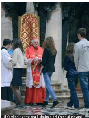
Il Cardinale consegna il simbolo del Credo ai giovani