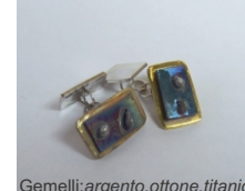
Massimo Sciancalepre Gemelli: argento, ottone, titanio

In comune hanno l'approccio artistico al mestiere appreso dal Maestro Davide De Paoli.