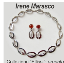
Irene Marasco Collezione "Ellissi": argento