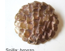
Naoko Iyoda Spilla: bronzo