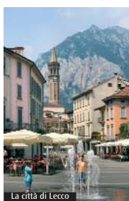
La città di Lecco

Testimoniare le belle realtà presenti e interrogarsi sulle necessità, sul ruolo e sui desideri dei giovani: questo il fulcro della serata «Lecco, una città per i giovani!», prevista presso il polo lecchese del Politecnico di Milano per giovedì 18 maggio, ore 20.45. L'iniziativa, inserita all'interno dei Dialoghi di vita buona della Chiesa di Milano e realizzata in collaborazione con il progetto «Avere cura del bene comune» del Servizio Giovani di Lecco, punta a creare un percorso di racconto e ascolto rispetto alle esperienze e alle esigenze dei ragazzi all'interno del contesto della città. Dopo un video